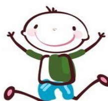
Rodolphe Secrétaire Photographe